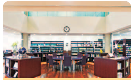
約10万冊の書籍を所蔵できる蛭雪図書館