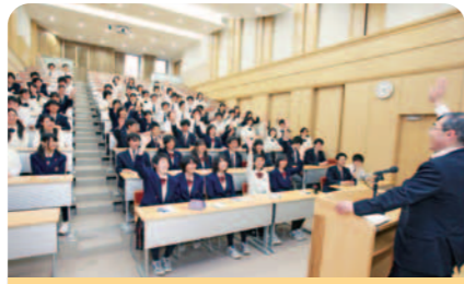
158名を収容できる栄冠ホール