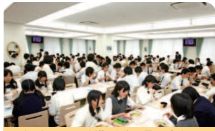
ICカードシステムを導入した王子・王女ホール