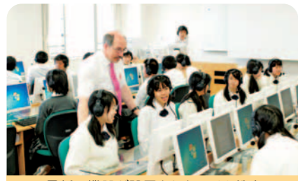
最新の機器が設置されたCALL教室